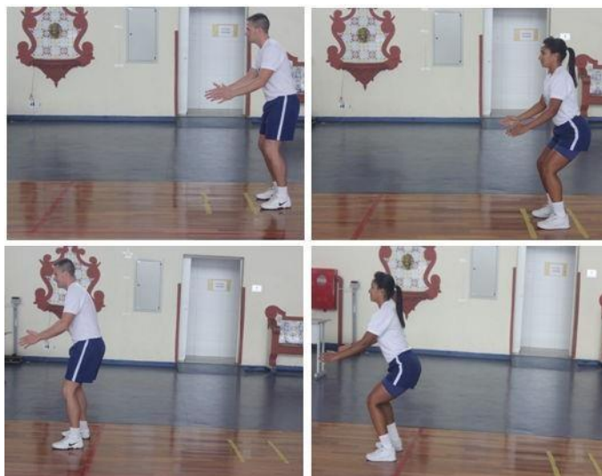
Figura 3 - Teste de salto horizontal.

Obs.: Neste teste, serão exigidos os mesmos padrões de execução para ambos os sexos.