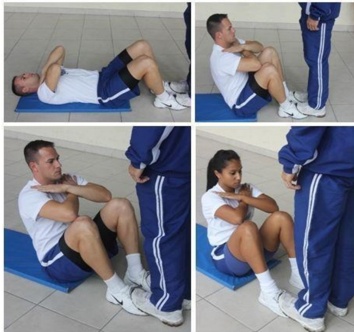
Figura 2 - Flexão do tronco sobre as coxas.

Obs.: Neste teste, serão exigidos os mesmos padrões de execução para ambos os sexos.